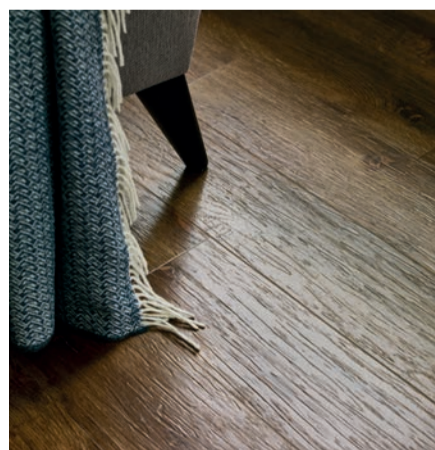
Kollektionen består av totalt 22 trä mönster med 2 olika ytor samt 6 moderna stenmönster.